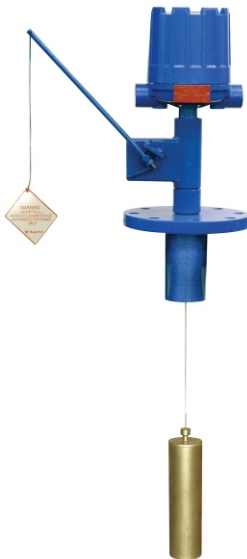
Chave Displacer Montada em Topo

Existem alguns dispositivos simples e muito confiáveis, chamados chaves de nível Displacer, que tem sido usado para este propósito por muitos anos.